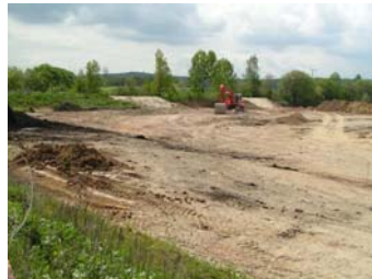
Areal zu Beginn der Arbeiten