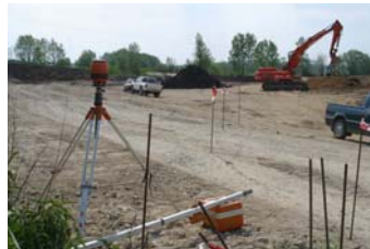
Durchführung der Erdarbeiten