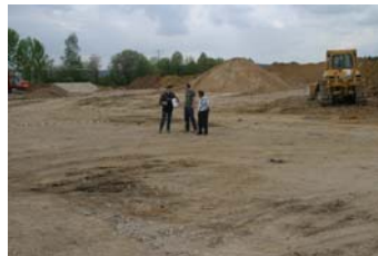
Festlegung von Details vor Ort