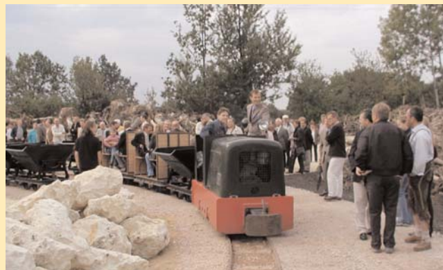
Die Rundfahrt im Lehrpfad mit der restaurierten Grubenlok ist ein Erlebnis.

Infos unter www.roesl.de . Zufahrt über die Schwalbenneststraße.