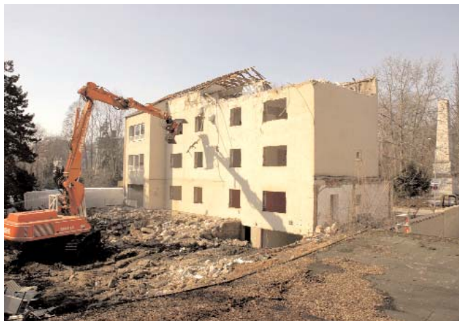
Nur wenige Tage dauerte der Abriss in der Regensburger Albertstraße.

der Albertstraße 11 seine Dien- ste jahrzehntelang erfüllt. Jetzt muss es weichen. Für den Ab-